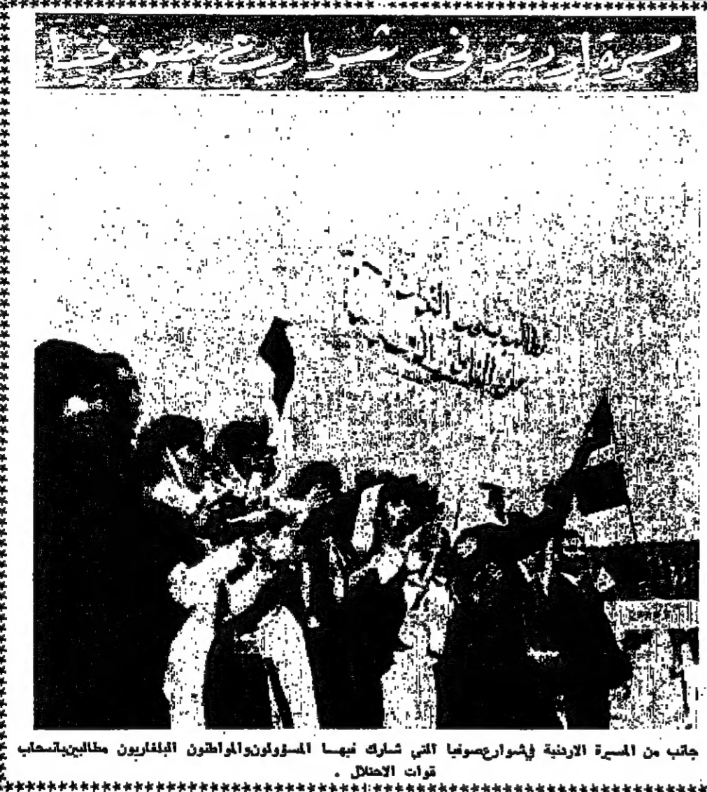
جانب من المسيرة الأردنية في حوار صوفيا التي شارك فيها المسؤولون والمواطنون الفلسطينيون مطالبين بحل قوات الاحتلال.

السبت في 1٥ جمادى الأولى سنة ١٣٨٨ هـ الموافق ١٠ آب سنة ١٩٦٨ م رقم العدد ٤٨١